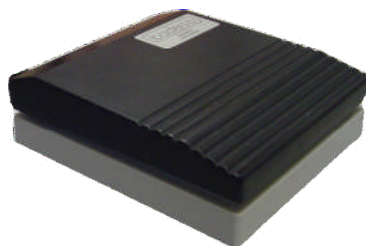
Pédale de contact Pedal für Ein/Aus-Schaltung On/off footswitch