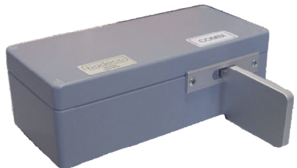
Pédale COMBI multifonctions COMBI Regelpedal COMBI footswitch